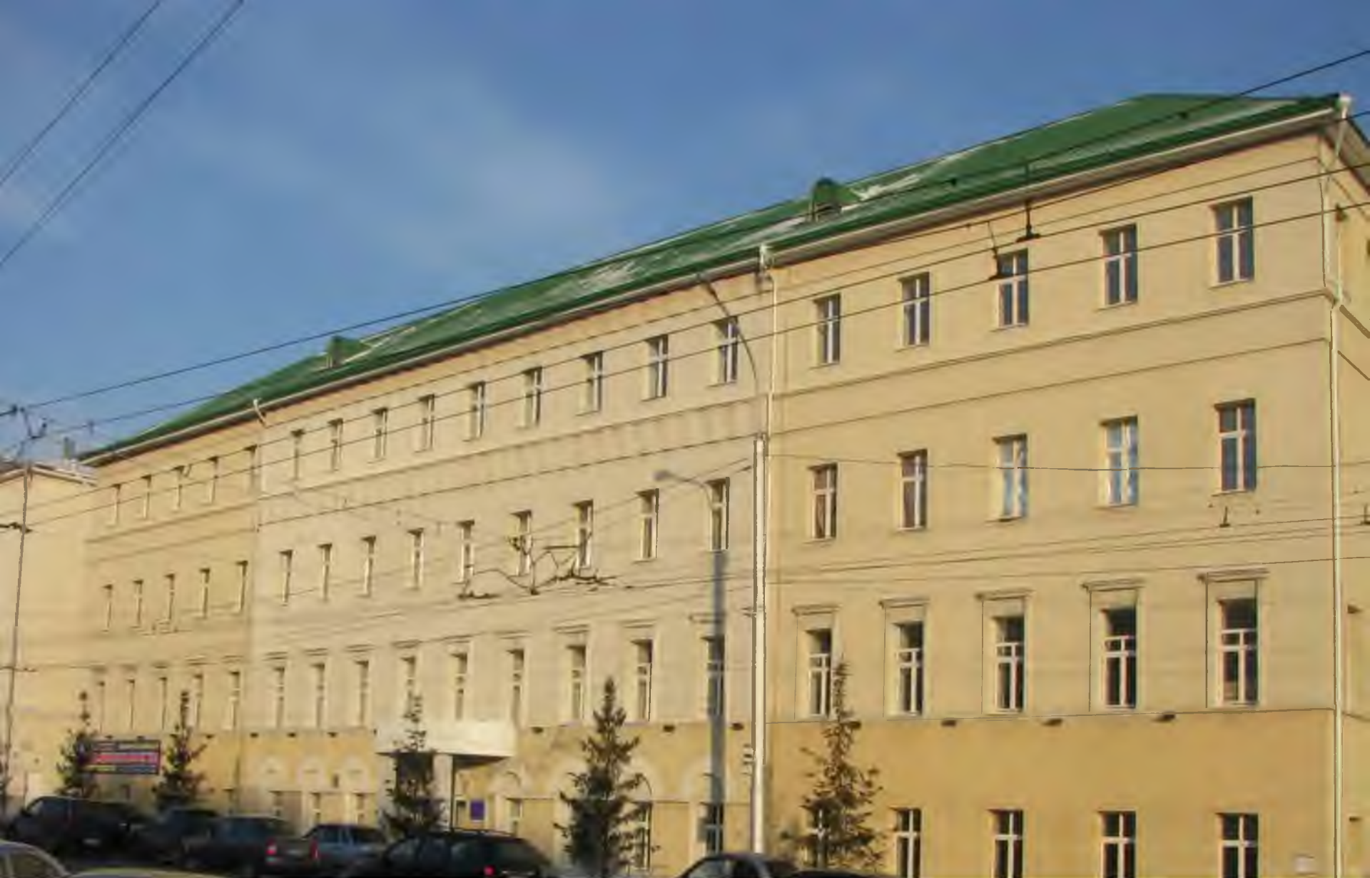
Корпус №6 ул. Заки Валиди, 45/1