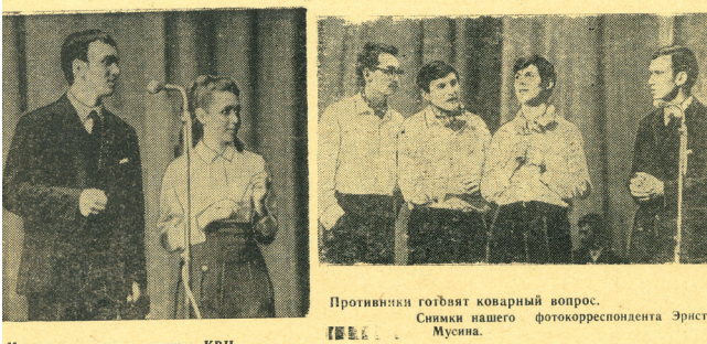
Противники готовят коварный вопрос.

Профессор Кулавакский вспоминает, что во время выступления были как промахи, так и ошибки. В чем-то студенты БГМИ были лучше студентов БГУ, а в чем-то им уступали. Наша команда ответственно отнеслась к выполнению своего "домашнего задания" - "Что было бы, если бы не было КВН?". Хорошо себя показали на выездном конкурсе. Несколько хуже соперников выполнили задание "Студенческое кафе", оказались слабее в литературном и художественном конкурсах. Свою лепту в победу внесли и верные болельщики, которые каждый раз поддерживали нашу команду дружным "Молод-цы!" К слову сказать, это был не только первый победный, но и в принципе первый КВН для нашей команды вообще.