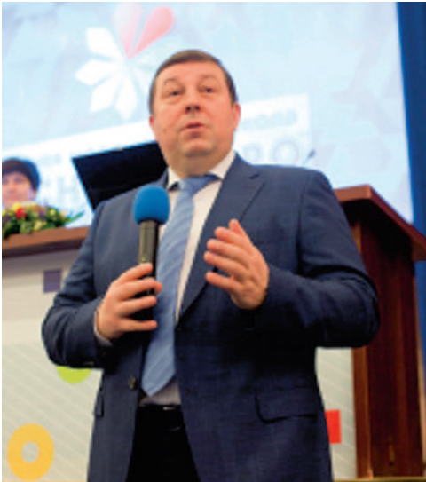
Зимняя школа Sechenov.PRO

С 31 января по 4 февраля 2018 года на территории санатория «Звенигород» Сеченовского университета для финалистов Олимпиады «Я — профессионал» проходила Зимняя медицинская школа Первого МГМУ им. И.М. Сеченова «Sechenov.PRO», в которой приняли участие десять студентов Лечебного и Стоматологического факультетов БГМУ - финалисты