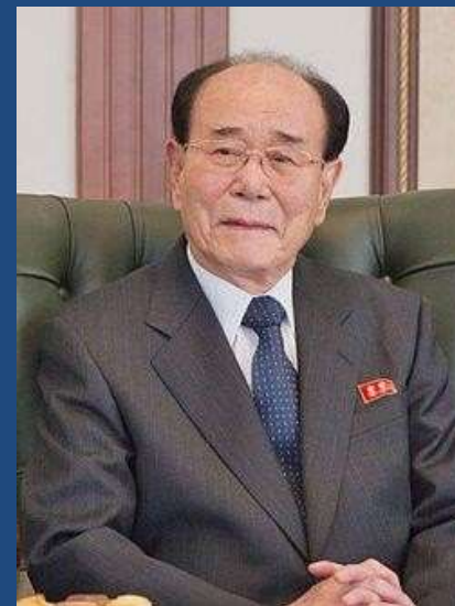
Ким Ён Нам

Первый заместитель председателя Совета Народных Комиссаров Советского Союза