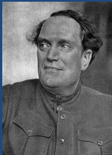
Валериан Владимирович Куйбышев

Председатель Совета Министров в Российском правительстве у Верховного правителя адмирала А. В. Колчака