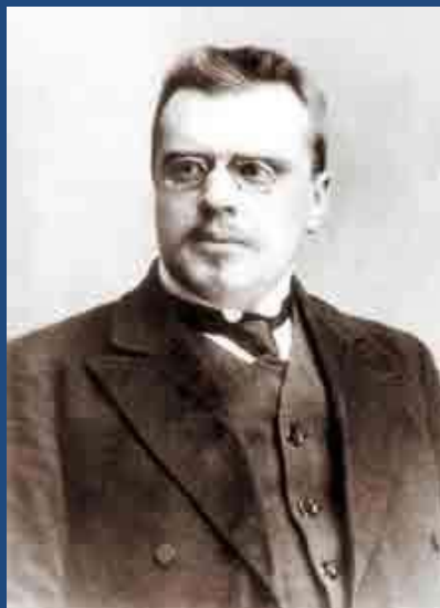
Виктор Николаевич Пепеляев

Председатель Совета Министров в Российском правительстве у Верховного правителя адмирала А. В. Колчака