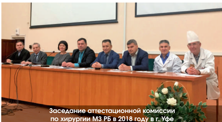
Заседание аттестационной комиссии по хирургии МЗ РБ в 2018 году в г. Уфе