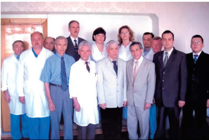
Коллектив кафедры детской хирургии с курсом ИДПО (2008 год)

Республики Башкортостан, но и из различных городов России и ближнего зарубежья. Сотрудники кафедры совместно с коллективом хирургических отделений