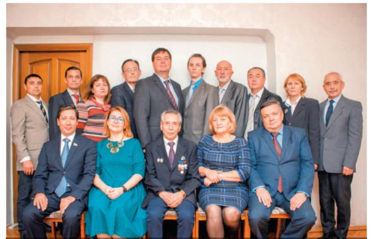
Коллектив кафедры детской хирургии с курсом ИДПО (2016 год)

осуществляют лечебный процесс в различных областях детской хирургии, участвуют в разработке и реализации региональных программ.