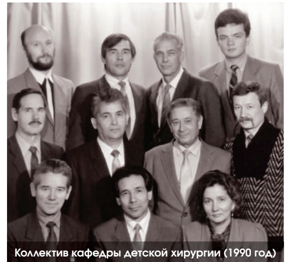
Коллектив кафедры детской хирургии (1990 год)

Успешно работает Башкирское региональное отделение Общероссийской общественной организации «Российская Ассоциация детских