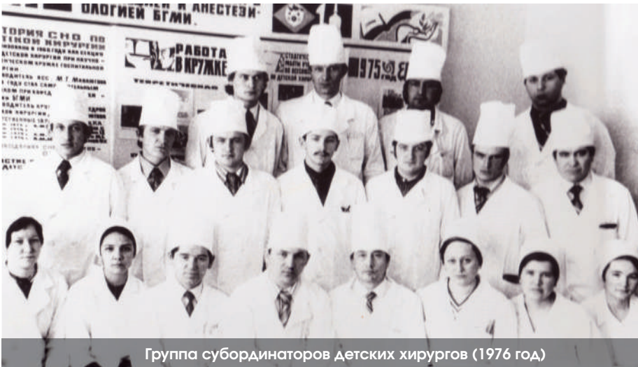
Группа субординаторов детских хирургов (1976 год)