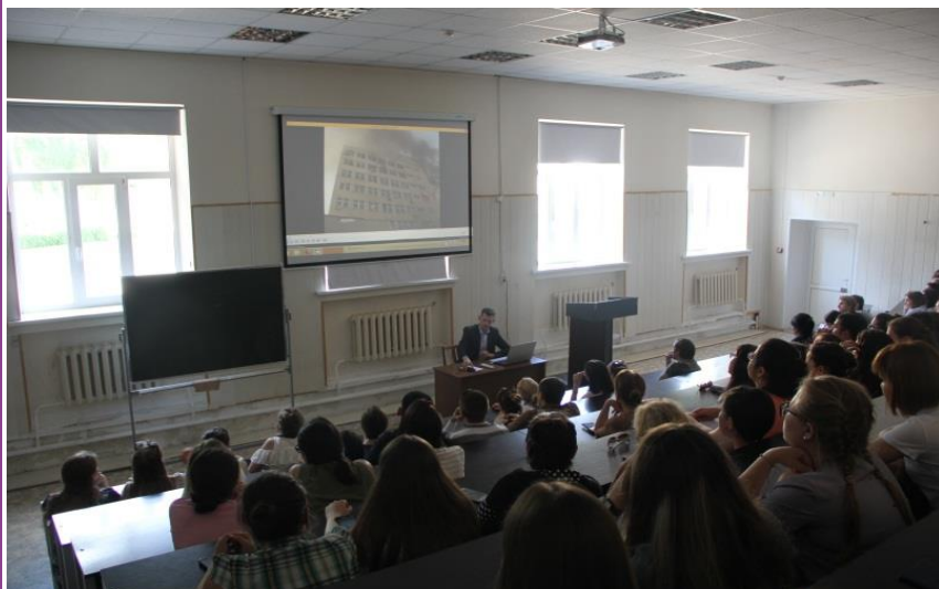
ФГБОУ ВО ОрГМУ Минздрава России (г. Оренбург).