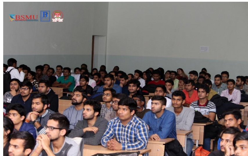
Собрание по ПБ с иностранными обучающимися