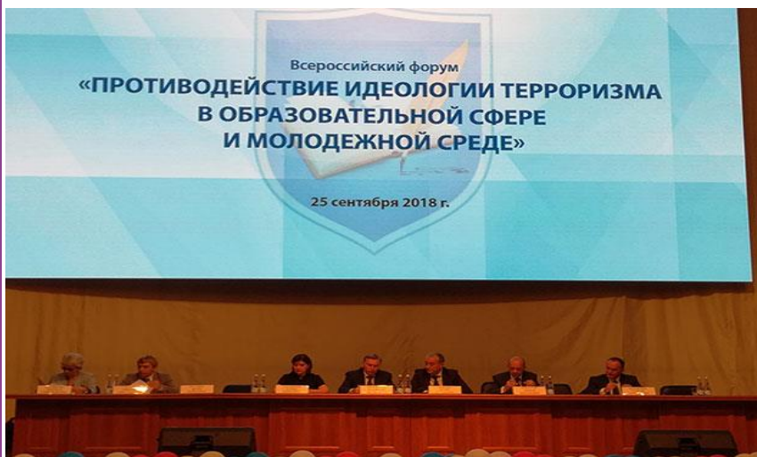
Всероссийского форума «Противодействие идеологии терроризма в образовательной сфере и молодежной среде».