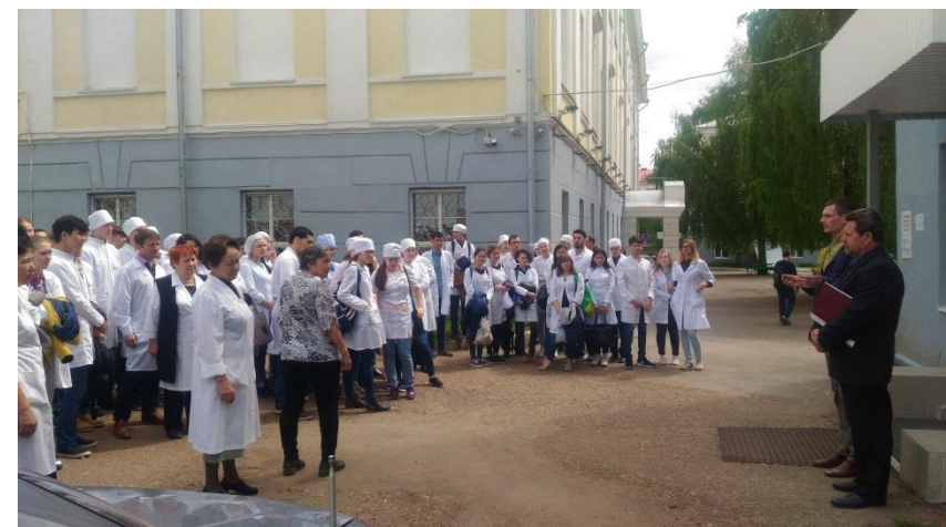
Учебная эвакуация из корпуса №5