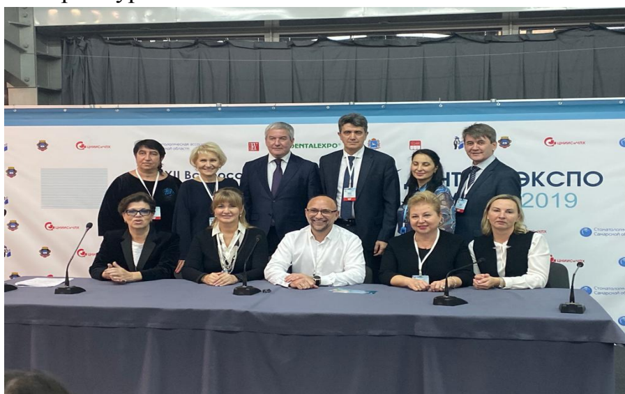
Рис. 1. Докладчики после конференции

Награждение победителей состоялось во время 3-го международного эндодонтического конгресса, проводился в рамках выставки «Дентал-Экспо 2019» в г. Екатеринбург.