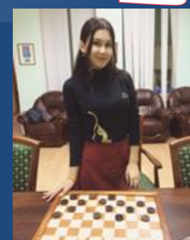
Аюпова Руфина – чемпионка мира на международном чемпионате мира по шашкам в 2018 году