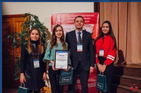
Проект Тьюторского движения БГМУ признан лучшим среди медицинских вузов России