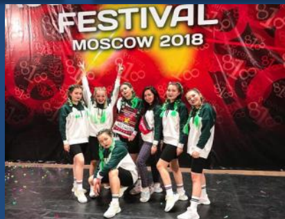
Танцевальный коллектив «MedDance» занял 3 место в номинации «Best dance performance» на Чемпионате современного танца «Project 818» в г. Москве