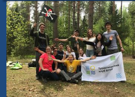
Туристический клуб БГМУ занял 2 место в турслете студентов-медиков России