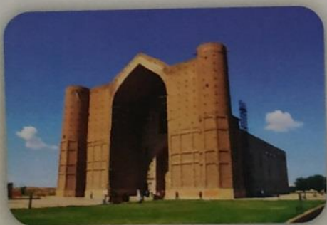
Ректор ЮКМА, д.м.н. профессор

Желаем Вам дальнейших успехов в работе, крепкого здоровья, благополучия и процветания!