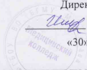
ГРАФИК ПРОХОЖДЕНИЯ ПРОИЗВОДСТВЕННЫХ ПРАКТИК I СЕМЕСТР 2023-2024 УЧЕБНОГО ГОДА ПО СПЕЦИАЛЬНОСТИ 31.02.03 ЛАБОРАТОРНАЯ ДИАГНОСТИКА