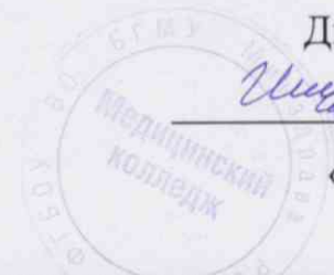
ГРАФИК ПРОХОЖДЕНИЯ ПРОИЗВОДСТВЕННЫХ ПРАКТИК I СЕМЕСТР 2023-2024 УЧЕБНОГО ГОДА ПО СПЕЦИАЛЬНОСТИ 33.02.01 ФАРМАЦИЯ