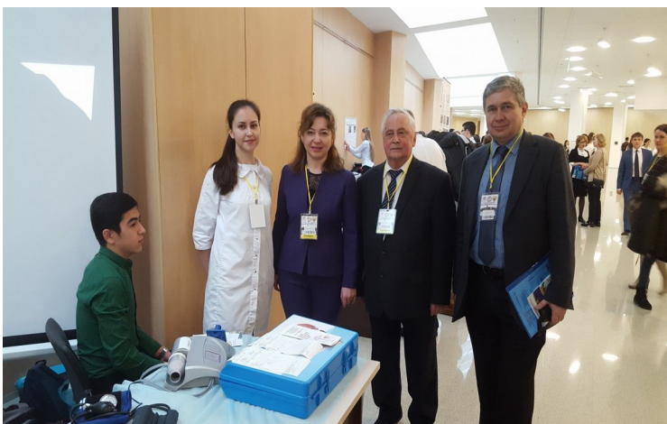
На выставке научных кружков БГМУ (Уфа 2017г.)