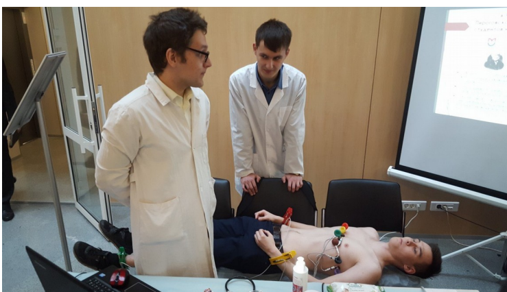
Работа кружковцев на выставке научных кружков БГМУ (Уфа 2017г.)