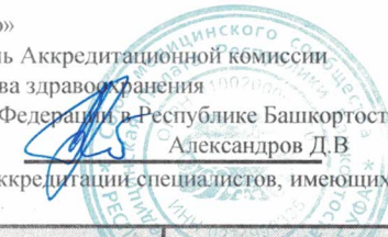
График работы аккредитационной комиссии Минздрава России по Республике Башкортостан для проведения первичной специализированной аккредитации специалистов, имеющих высшее медицинское и иное образование в ЗИМНИЙ ПЕРИОД 2025 ГОДА