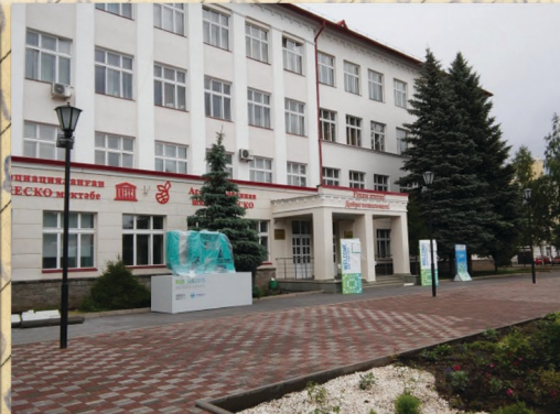
Здание госпиталя в 2020г.

В эвакогоспитале были внедрены принципы лечения подострых форм закрытой травмы головного мозга, лечение каузалгии, внедрены новые методы хирургического лечения огнестрельных повреждений периферических нервных стволов. Пролечено около 25 тысяч раненых и больных.