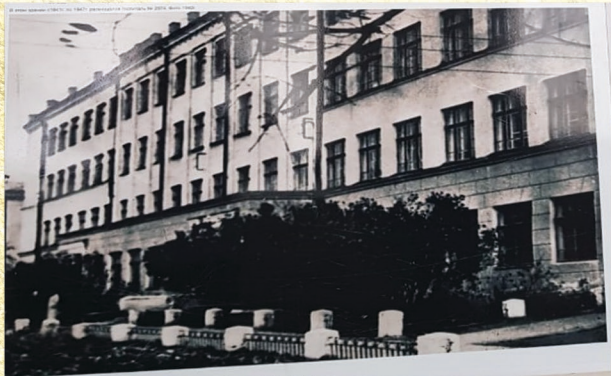
Здание госпиталя в 1942г.