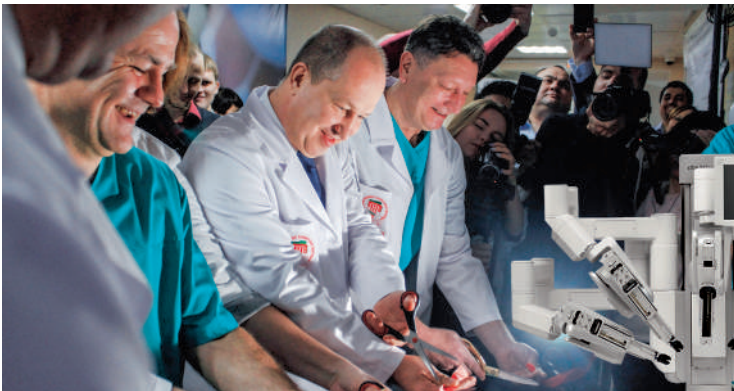
Открытие центра роботической хирургии в Клинике БГМУ