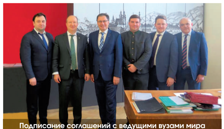
Подписание соглашений с ведущими вузами мира