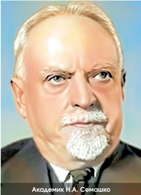
Академик Н.А. Семашко

Заканчивался 9-й учебный год Башкирского медицинского института имени XV-летия ВЛКСМ.