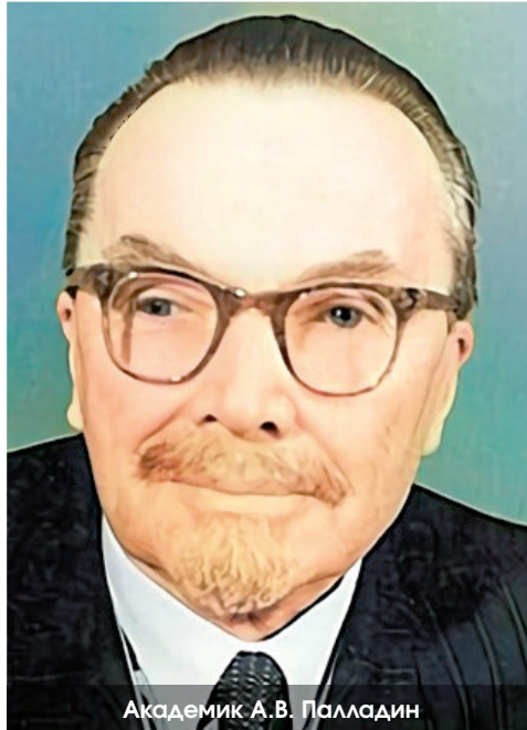
Академик А.В. Палладин

Студенты по окончании экзаменационной сессии собирались на каникулы домой или на производственную практику, а выпускному курсу оставалось сдать последний государственный экзамен, - и вот грянула война!