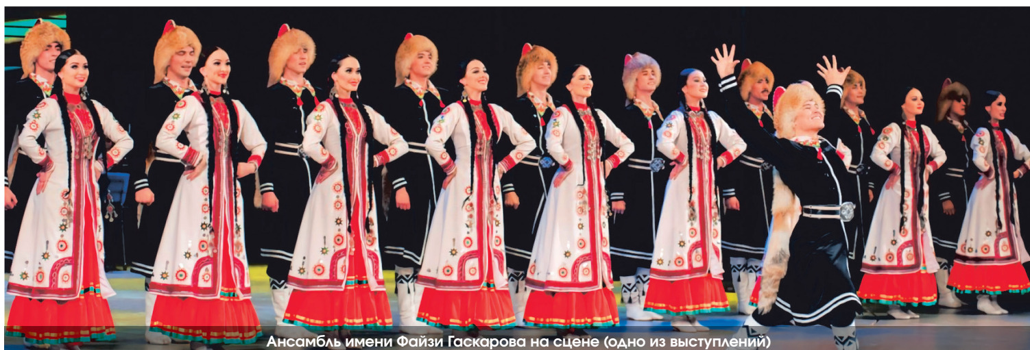
Ансамбль имени Файзи Гаскарова на сцене (одно из выступлений)

Башкирский народный танец, осваивая свойственные прошлому способы и нормы жестового языка, верования, культовые представления, обрядовые реалии, за многие столетия своего развития сформировался ярким образом драматического искусства, глубоко отображающим национальный дух, психологию и пластический стиль своего создателя.