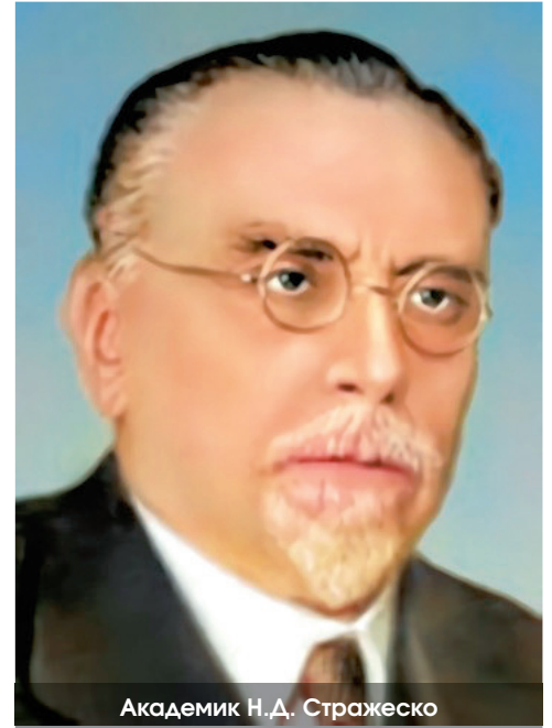
Академик Н.Д. Стражеско

В 1941 году в Уфу были эвакуированы Акаде-