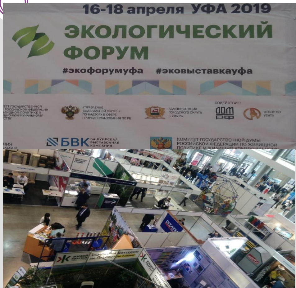
Международного экологического форума и IV специализированной выставки «Экология. Технологии. Жизнь» (г. Уфа)