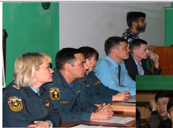
Собрание по ПБ с иностранными обучающимися и ГУ МЧС