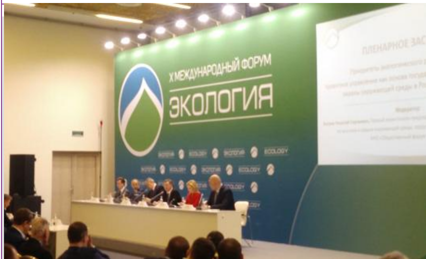
X Международный форум «Экология» (г. Москва)