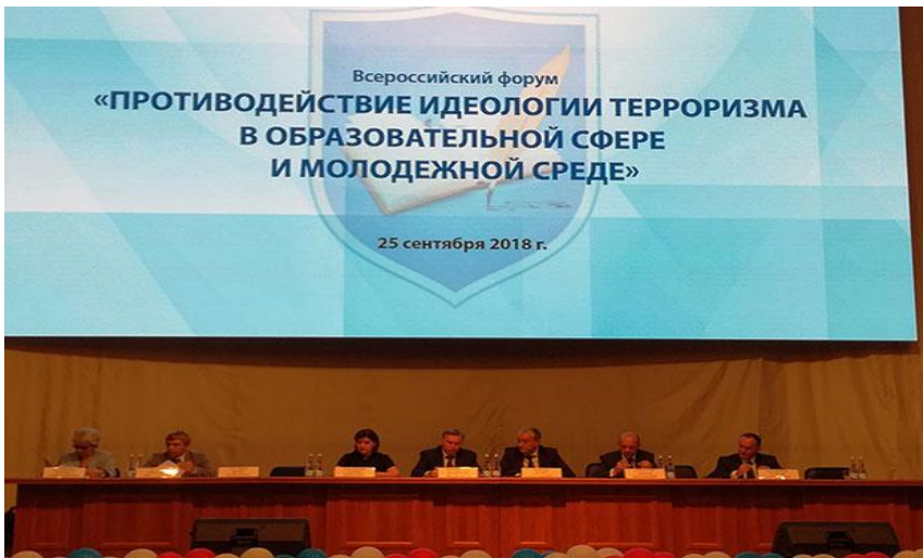
Всероссийский форум «Противодействие идеологии терроризма в образовательной сфере и молодежной среде».