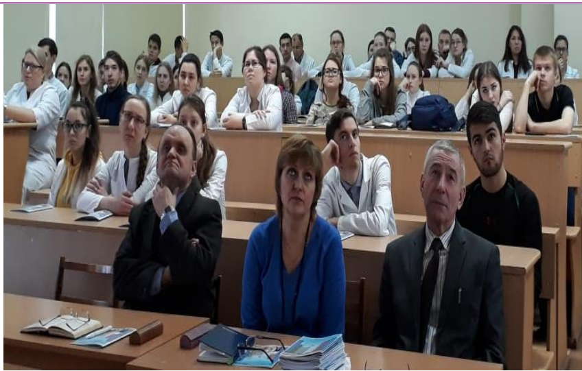
Совещание в ФГБОУ ВО ИГМА Минздрава России (г. Ижевск).